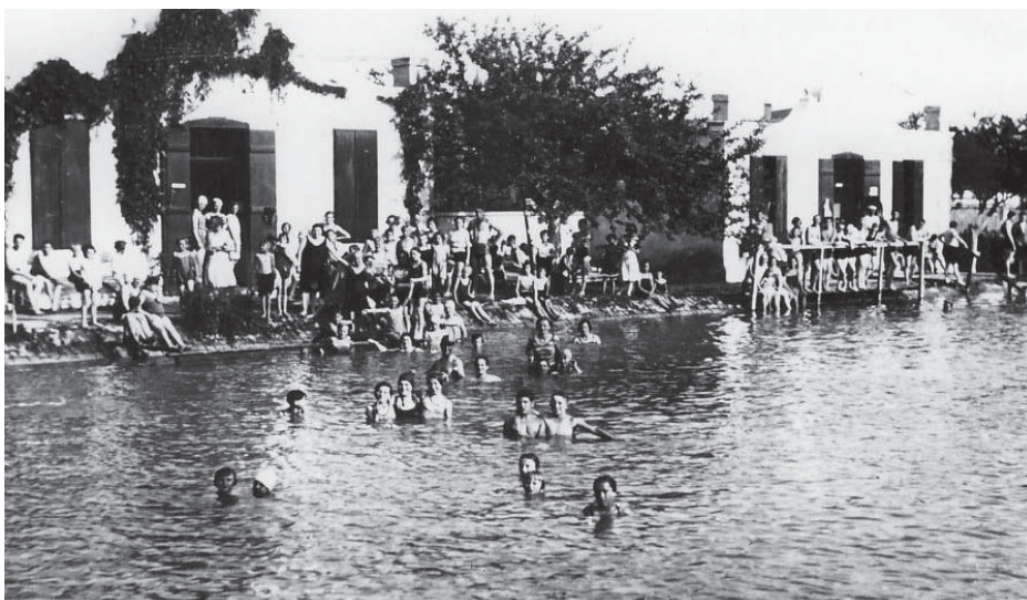
Plovárna z 30. let.

„Počasí bylo zcela jiné. Když se v květnu dláždily bazény, bylo strašně vedro. Dělníci ani nemohli pracovat, dělali v noci, svítili si reflektory. Ale když se otvíralo, bylo 16 stupňů. Já jsem na uvítanou rozdávala šály okolo krku,“ usmívá se tehdejší místostarostka.