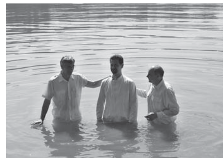
Křest ve vodě.

Ve sboru se během prázdnin odehrály dvě významné události. První bylo požehnání nově narozených dětí. Protože naše církev křtí až v dospělosti na vyznání víry, přináší rodiče své novorozené děti do církve, aby je představili, a současně žádají o modlitby a požehnání. Tato událost je často provázena