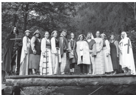
Děti se na táboře ocitly v době smrti krále Přemysla Otakara II.

První skupina se zkraje července vydala na týden do Moravského krasu, kde spolu s Rychlími šípy hledaly Ježka v kleci a jeho tajemství. Tento tábor probíhal v objektu bývalých kasáren v Hostěnicích ve spolupráci s 24. přední hlídkou RR Brno 2. Děti se staly