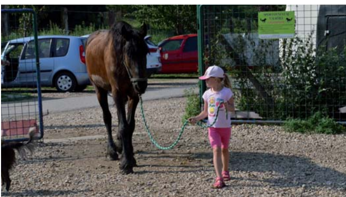
Příměstské tábory na ranči Valkýra se konaly po celé prázdniny. Celkem se na 8 turnusech prošťovalo zhruba 120 dětí ve věku od 4 do 13 let.