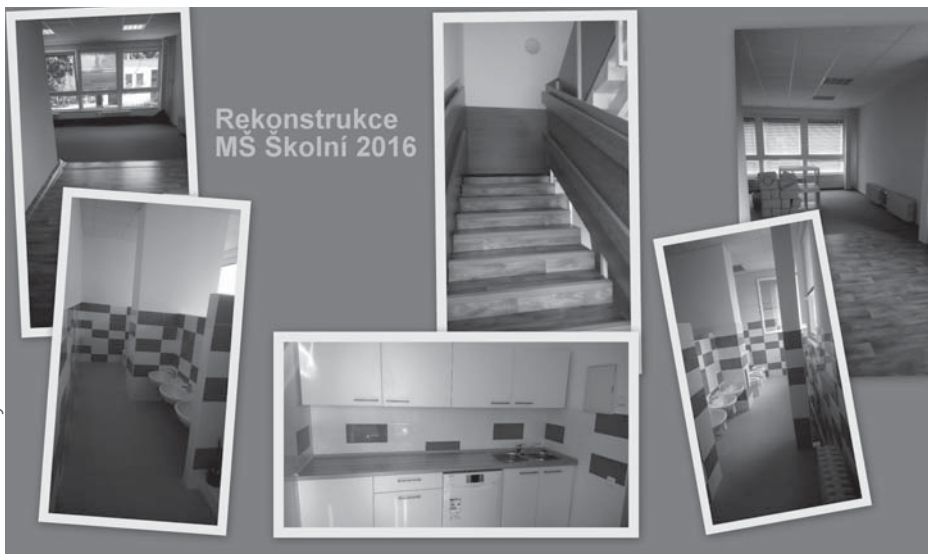
Rekonstrukce MŠ Školní 2016