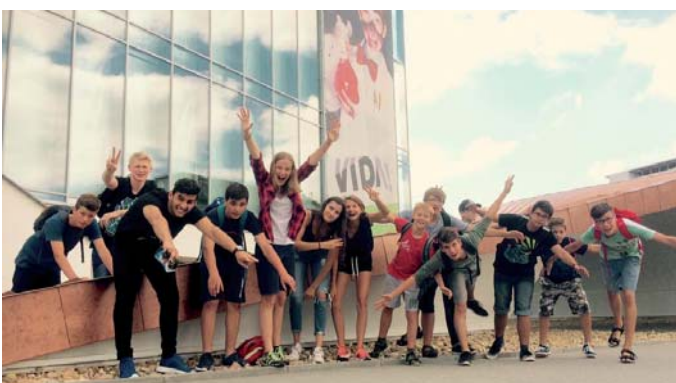
Volejbal, lesní golf, koupání, cyklovýlet, návštěva zábavního vědeckého parku, florbal i sjíždění řeky – to čekalo na mládežníky od 12 do 15 let na příměstském táboře Sportovní teen camp.