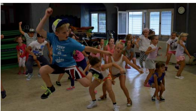
V úplné hvězdy z hudebních videoklipů se přetělo třicet dětí v sále Pavučiny druhý srpnový týden. Zúčastnily se tanečního příměstského tábora se skupinou Move Around.