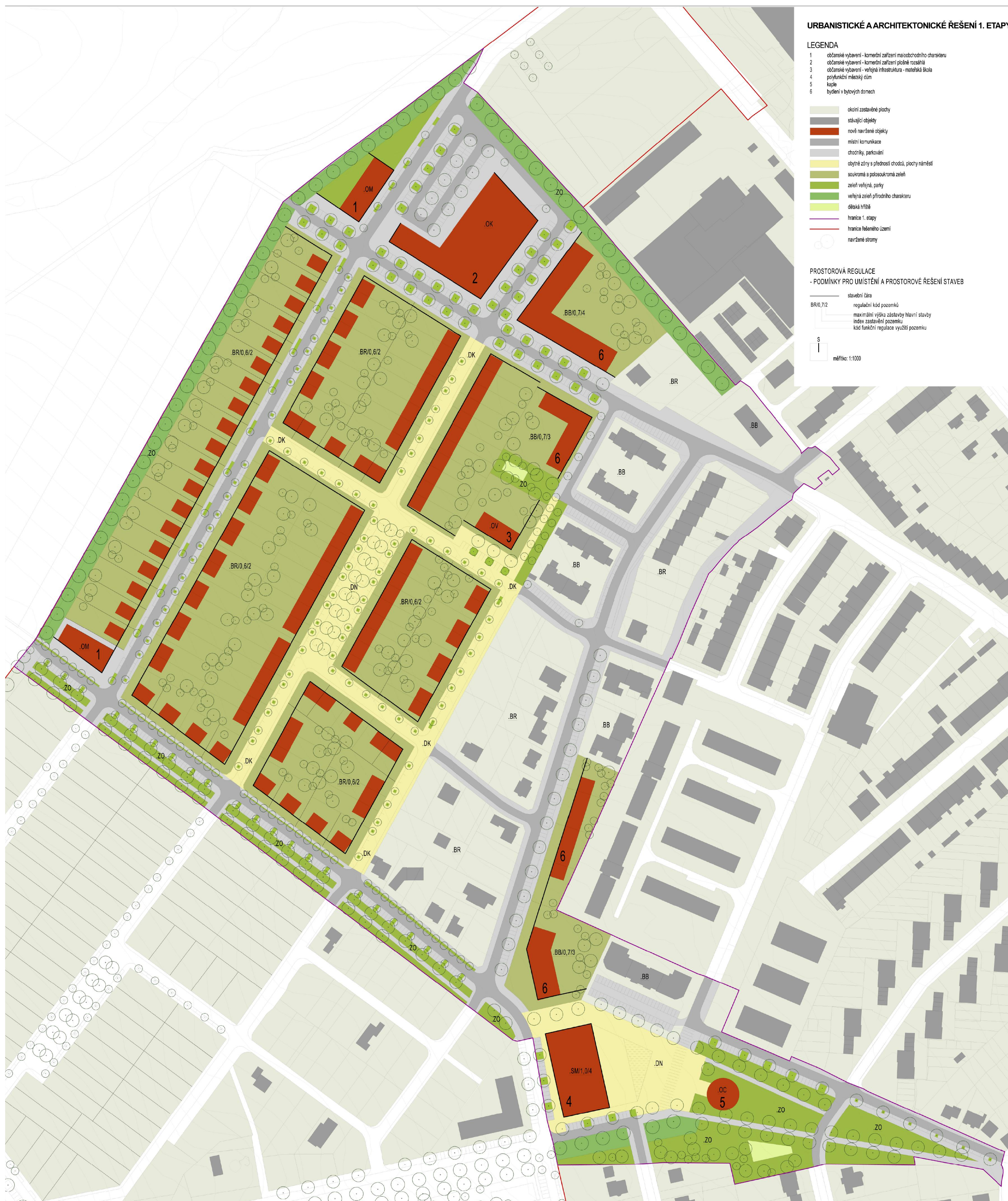
URBANISTICKÉ A ARCHITEKTONICKÉ ŘEŠENÍ 1. ETAPY