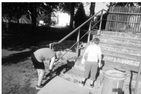
Mladí fotbalisté pomáhali natírat