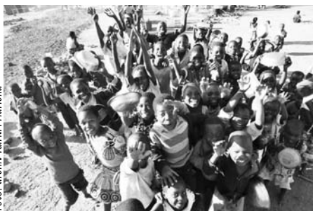
Africké děti jsou plně elánu.