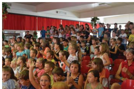
Žáci fandili jako o život.