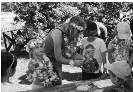
Světové rozloučení se školním rokem.