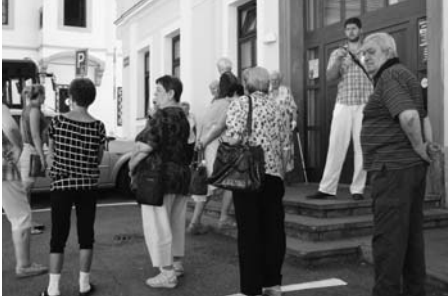
Senioři byli převezeni do budovy MěÚ Hustopeče.

Ve čtvrtek 20. července se silnice u Penzionu pro důchodce v Hustopečích zaplnila hasičskými auty. Konala se zde historicky první evakuace jeho obyvatel, která bylo součástí taktického cvičení hasičského záchranného sboru. Senioři, po vyhlášení poplachu, opustili své domovy a shromáždili se na bezpečném místě v blízkém parčíku.