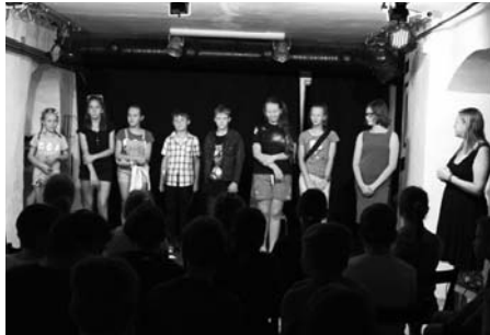
Děti bavily děti divadlem.