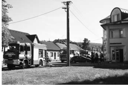
U požáru zasahovalo několik hasičských aut.

Na cvičení se podílely složky Integrovaného záchranného systému. Jednalo se o Hasičský záchranný sbor Jihomoravského kraje Hustopeče a jednotky sboru dobrovolných