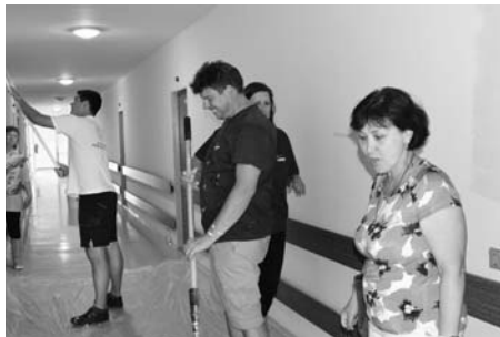
Help Day opět pomáhal.

V tomto roce se dobrovolníci sešli v Penzionu, kde malovali dvě patra chodeb a nabídli obyvatelům, že jim vymalují jejich bytovou jednotku. Tuto možnost nakonec využila devadesátiletá seniorka. Účast zaměstnanců na akci byla dobrovolná. „Letos