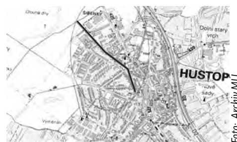
Akci podporovalo vedení města.