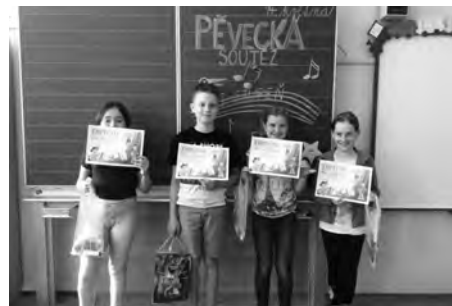
Na prvním stupni rádi zpíváme a rádi i soutěžíme.