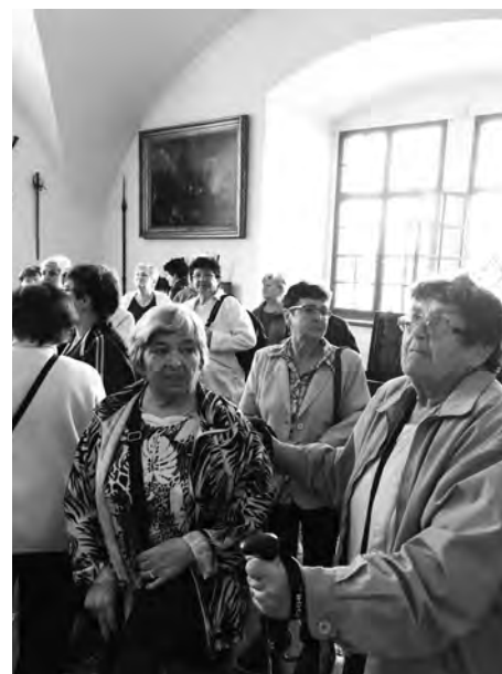
První zájezd vedl do Bučovic, Brna a Dolních Heršpic.