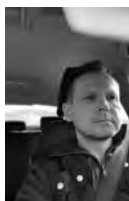
Jsem tu pro to, aby jste mohli moderně bydlet