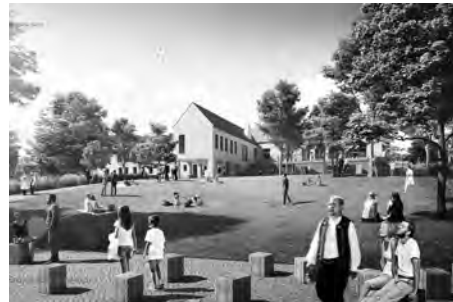
Nová tvář společenského domu.