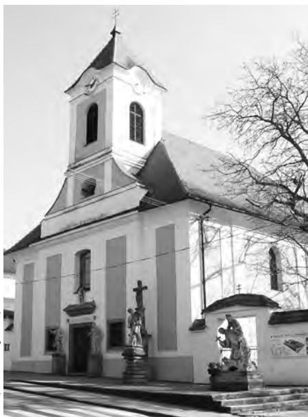
Kostel sv. Anny v Žarošicích.