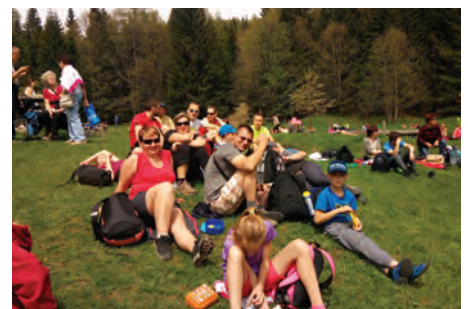
Náročnější terén soutěsky nabízel krásné výhledy i 164 lávek a žebříků.