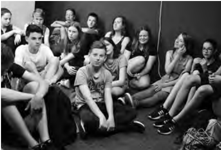
Školáci si vyzkoušeli práci hustopečské televize.