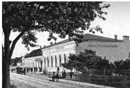
Původní tvář společenského domu.