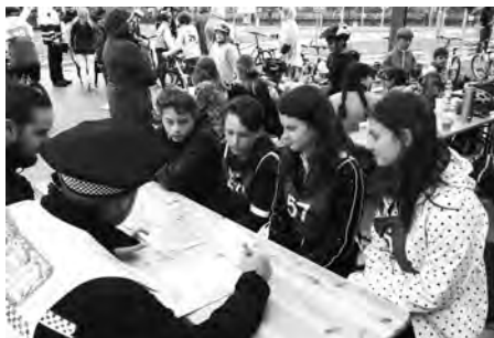
Cyklisté starší kategorie postupují do okresního kola v Břeclavi.