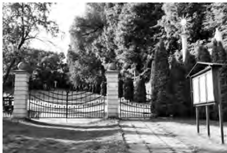
U Svaté v Křepicích.