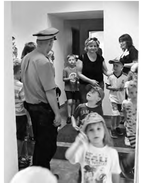
Městská policie představila výzbroj a svou činnost.

Celý den byl velmi rušný. Na úřadě se střídaly skupiny školek a škol i návštěvníci, kteří chtěli poznat městský úřad jinak. „Dozvěděli jsme se různé informace o fungování úřadu,“ uvedl jeden z žáků. „Přijde mi tady všechno zajímavé a dost věcí, které jsem dnes zjistil, určitě zúročím v životě,“ dodal jeho spolužák. „My jsme se přišli podívat na krásnou budovu radnice,“ vysvětlila důvod své návštěvy seniorka z Brna.