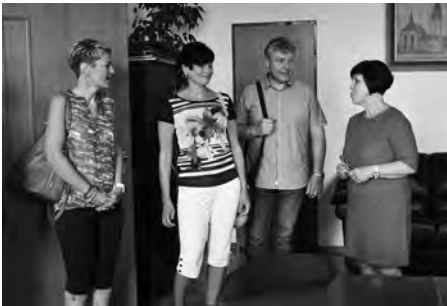
Návštěvníci si prohlédli kanceláře vedení města.