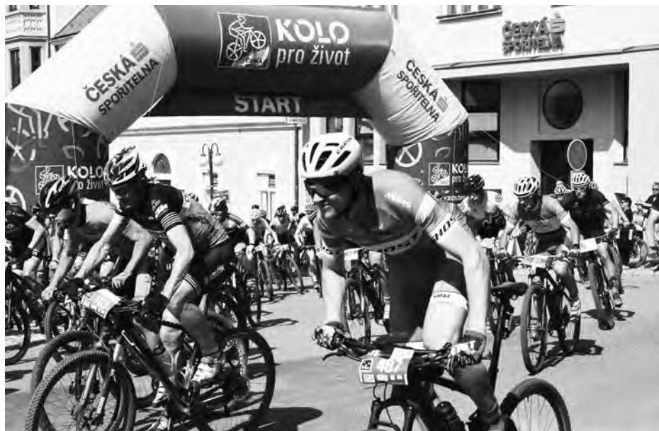
Cyklistický závodní seriál startoval z Hustopečí.

Závod měl tradičně zázemí v areálu společnosti Agrotec, kde měli cyklisté veškerý servis a také zde byla dětská zóna a konaly se zde dětské závody. Na závodním okruhu se postupně vystřídaly všechny věkové kategorie