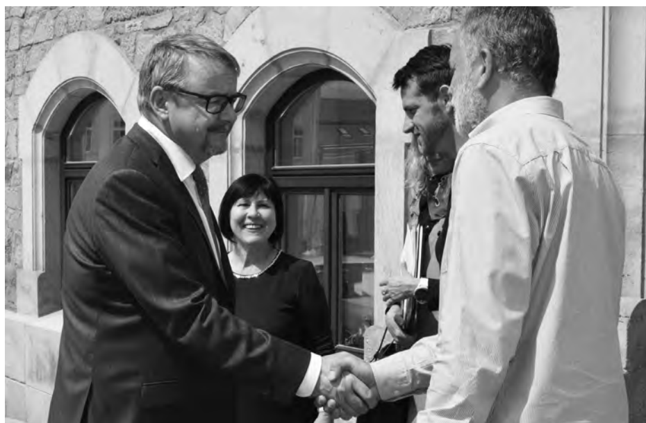
Ministr dopravy Ťok se přivítá se zástupci města.