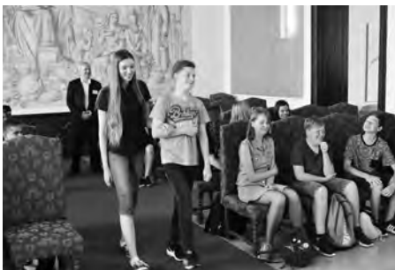
V obřadní síni se oddávalo.