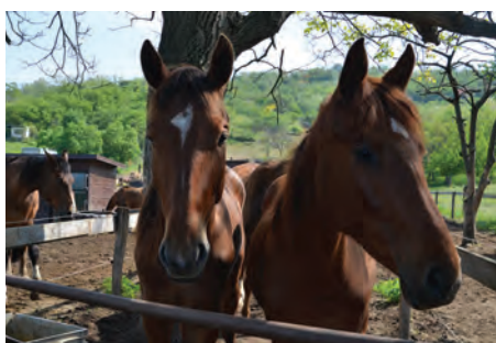
Na Valkýře mají řadu nových mláďat.

Mláďata mají nyní ovečky i kozy. Ve společném výběhu s lamami skáčou klokani. Pozorný divák může zahlédnout, že klokaní samici vykukuje z vaku půlroční mládě. „Je to naše třetí odchované mládě,“ řekla Sigmundová. Po odchování jdou klokani dál do světa. „Buď k jiným chovatelům klokanů, nebo je nyní