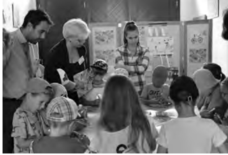
Na nejmenší čeklaly jednoduché dopravní testy.