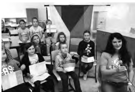
Mezinárodní videokonference projektu Schoolovision 2018 – náš soutěžní klip naleznete na stránkách školy.