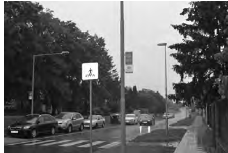
Oranžový přechod byl pomyslně otevřen.

Město Hustopeče uspělo v grantové výzvě Oranžový přechod vyhlášené Nadací ČEZ, díky které vybudovalo osvětlení u frekventovaného přechodu na ulici Komenského, vedoucího na dopravní hřiště. „Snahou Nadace ČEZ je pomáhat, prostřednictvím Skupiny ČEZ, v celé České republice. A to v oblasti kulturní, sportovní, charitativní i bezpečnostní. Jedním z těchto