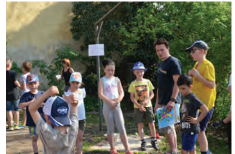
Den Země se v Hustopečích slavil společnou zábavou.