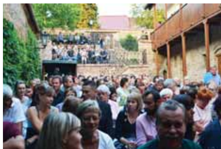
Nádvoří praskalo ve švech.