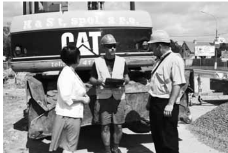
Na dvou lokalitách se čile pracuje, třetí hlásí hotovo.

Cílem žádosti bylo zbudování záchytných parkovišť, na kterých budou moci cestující odstavit auto a přestoupit na vlak nebo autobus. Ruku v ruce s touto myšlenkou jde i pláno-