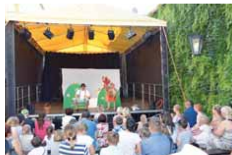
Děti pobavila pohádka Hrnecku vař.