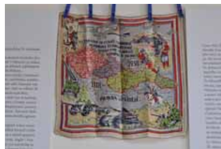
Exponáty připomínají naši minulost.