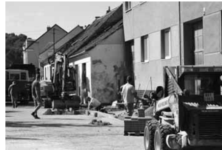
Bezbariérové trasy přinesly městu nové chodníky a místa pro přecházení.