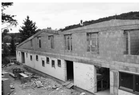
Dvoupatrová budova se otevře návštěvníkům v roce 2019.

Po pravé straně od vchodu se nachází taneční sál. Ten bude vybavený zrcadlovou stěnou, dvěma šatnami, skladem a je koncipovaný jako multifunkční prostor, který může sloužit i na spoustu jiných aktivit. Hojně využívaným místem na Pavučině byla vždy keramická dílna. „Budou v ní čtyři hrncířské kruhy a vypalovací pece. Místnost bude rozdělena na dva úseky, na glazovací část a na část samotné výroby, aby tu mohly fungovat dvě skupiny, aniž by se rušily,“ upřesnil Fridrich. Na dílnu