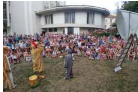
Kočovné divadlo zakončilo svou pouť v Hustopečích.

Po týdně doputovali v pátek 10. srpna konečně na domácí půdu – do Hustopečí. I přes mírnou únavu ze dnů, kdy teploty sahaly vysoko přes 30 stupňů, se na místní diváky těši-