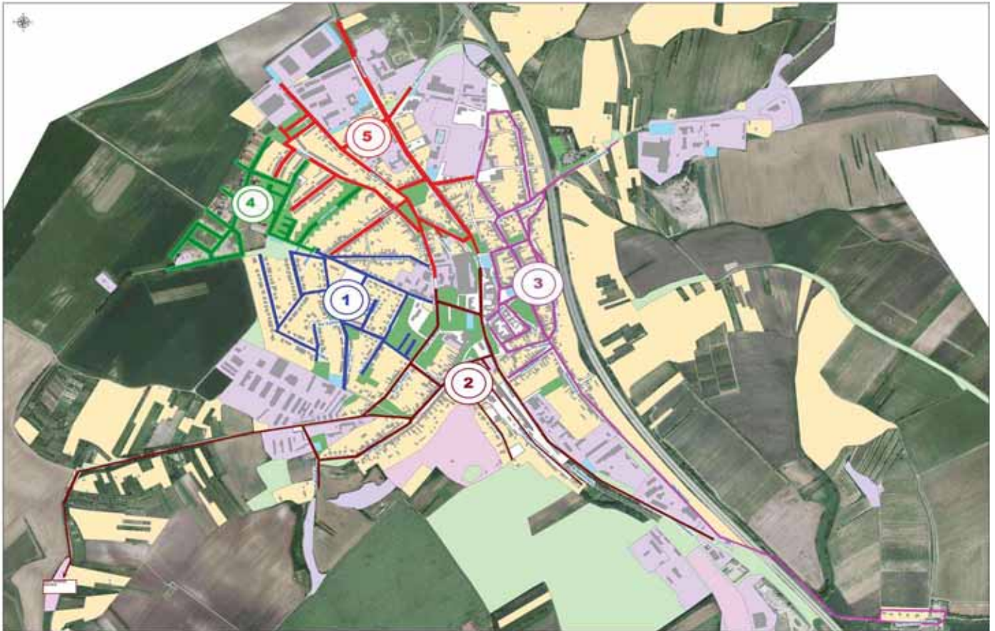
Volební okrsky, seznam ulic a volební místnosti pro volby do zastupitelstev obcí a pro volby do Senátu PS ČR v roce 2018