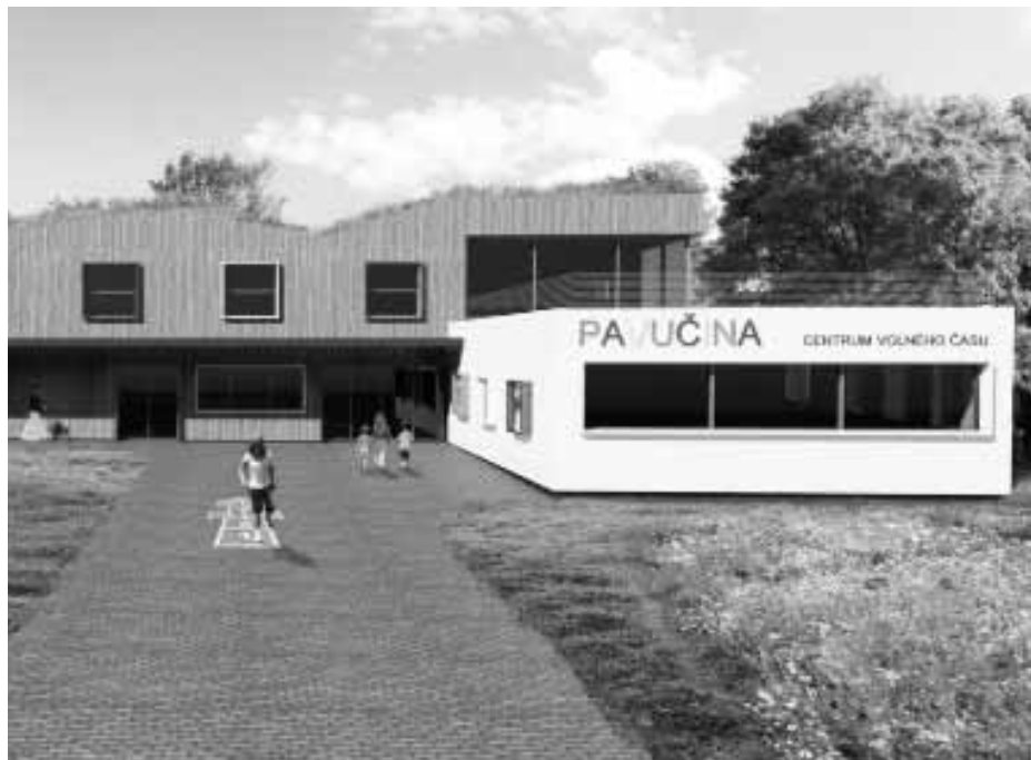
CVČ Pavučina přivítá od ledna děti v novém prostředí

Kulturní nabídka města se rozšířila o dvě nové akce, které potěší milovníky vín. Příchod léta se nyní slaví Hustopečským slunovratem s vínem a vína usilující o postup do Salonu vín ČR se degustují vždy na konci prázdnin na Národní soutěži vín Velkopavlovické podoblasti . Změnou prošel původní koncept Slavností mandloní a vína , nyní jsou zacílené více na gurmánské zážitky. Městské muzeum a galerie obohatilo své výstavní prostory o dvě nové stálé expozice: Hustopeče a trhy a Osvobození 1945 .