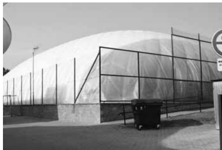
Nafukovací hala slouží žákům ZŠ Komenského, sportovním oddílům i veřejnosti.

vě najdou svoje místo i malá divadelní scéna, digitalizované kino, bar s kavárnou, menší sál pro přednášky a místní spolky nebo Turistické informační centrum.