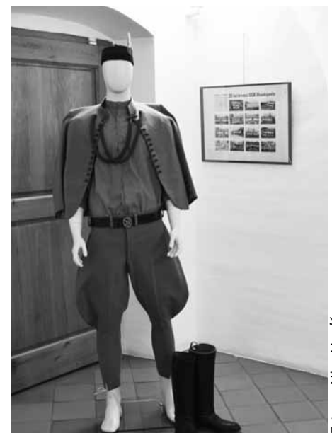
Výstava ukazuje Hustopeče před 100 lety.