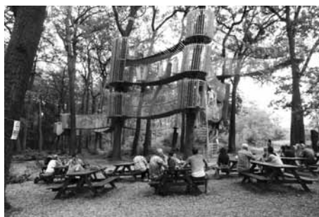
Výlet se povedl a počasí přálo.