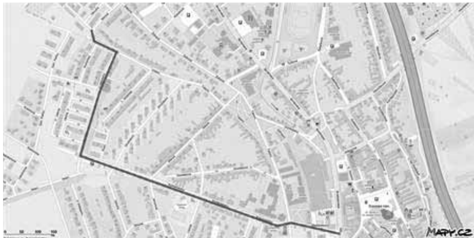
Bezbariérová trasa tentokrát povede ulicemi Komenského, přes Masarykovo náměstí a dále ulicemi U Větrolamu, Mírová, Okružní a Žižkova.

Opravovaná etapa vyplynula ze zpracovaného generelu bezbariérovosti. Ten má město připravený pro úseky podél místních komunikací, schválený Úřadem vlády a řešil i předchozí etapu. „V letošním roce jsme dokončili úseky od Městských služeb, přes Sv. Čecha, Tábor, Žižkovu a také Hybešovu, kde máme Poliklini-