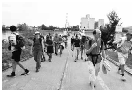
23 poutníků podniklo cestu do Mariazell.