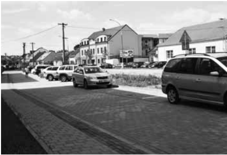
Součástí záchytných parkovišť jsou i nová místa v ulici Nádražní.