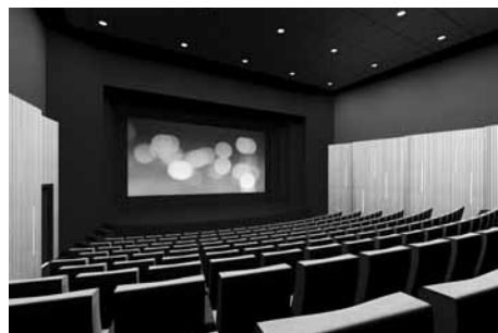
Vizualizace nového sálu v budově kina.

Zastaralá budova bývalého kina se mění na centrum kultury a informací. Hlavním impulsem byl chybějící divadelní sál s postupně se svažujícím hledištěm, komfortním prostředím pro návštěvníky a důstojným zázemím pro účinkující. V dvoupodlažní bezbariérové budo-