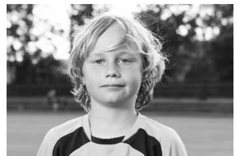
Náš hráč se účastnil slavného italského kempu.