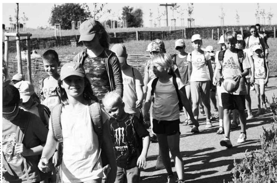
Tábory 2018: Nová kamarádství a plno spokojených úsměvů.