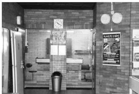
Opravy začnou ve vestibulu, moderní budou šatny, sprchy i toalety.

Krytý bazén v Hustopečích se po osmadvaceti letech fungování pochlubí kompletně novým zázemím. Modernizace vestibulu, šaten, ohříváren nebo sociálek je součástí projektu za více než 12 milionů korun. Z rozpočtu města je na něj vyčleněno přes 5 milionů, zbývající část pokryje dotace z Ministerstva školství. Dotace byla v řádném listopadovém kole v roce 2017 neúspěšná, mezi podpořenými žadateli se město Hustopeče posunulo až letos v květnu. I přes rychlé dopilování projektu a zahájení soutěže dodavatele nebylo možné stihnout prázdninový termín, kdy návštěvníci využívají krytý bazén jen minimálně. Stavební dělníci tak nastoupí od září, hotovo by mělo být v prosinci letošního roku.