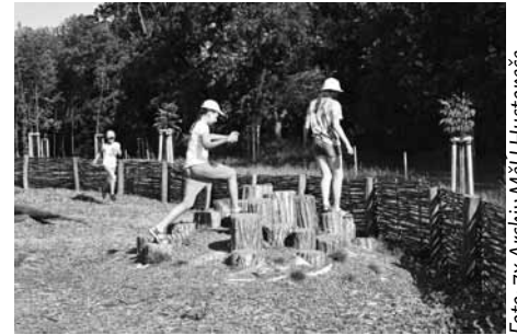
Nová relaxační zóna na Křížovém vrchu baví děti i dospělé.