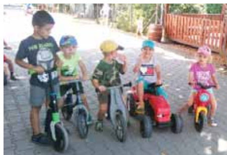
Děti ve školce strávily druhý měsíc prázdnin.

Dobu uzavření provozu jsme tradičně využili k pravidelnému malování - letos vymalování zelené a modré třídy, k hloubkovému čištění koberec, lůžkovin a ostatních textilií a k desinfekci hraček. Provozní zaměstnankyně to opět s velkým nasazením stihly včas, za což jim děkujeme. Také jsme nechali opravit všechno nefunkční zařízení, zrenovovali některé přístroje a ve třídách pracujeme na drobných úpravách. Opravujeme ještě i některé části zahrady, například drobné závady na herních sestavách, posezení a lavičkách. Opraveny by měly být i splachovadla na zahradních WC pro děti. Jelikož rekonstrukce školy letos neproběhla, museli jsme v kuchyni přistoupit k drobným opravám, například tlakovému čištění odpadů, seřízení některého vybavení atd.