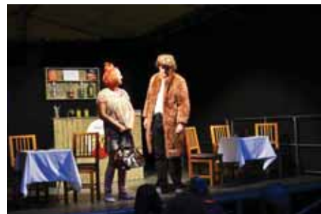
Na pódiu se odehrávaly různé lidské osudy.

Festival vyvrcholil v pátek 20. července komedií Zelňačka. Předlohou představení byla slavná kniha Reného Falleta. Hlavní role, scénáře i režie se ujal Oldřich Vízner: „Je to moc hezký příběh, mám ho rád.“ Představení