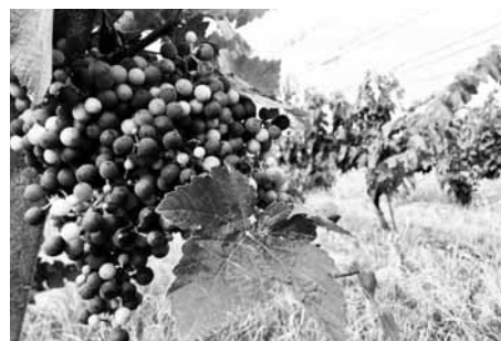
Vinohrady slibují bohatou úrodu.

„Řekl bych, že to s tím burčákem bude na hraně. Už tak jsou Burčákové slavnosti celkem