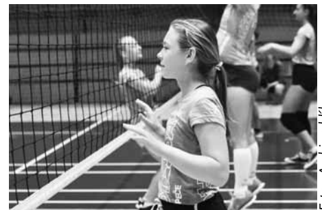
Mladí volejbalisté zdokonalovali své dovednosti