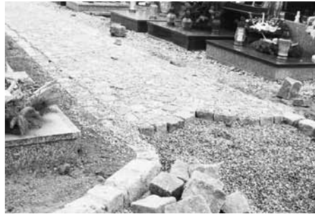
Nová relaxační zóna na Křížovém vrchu baví děti i dospělé.