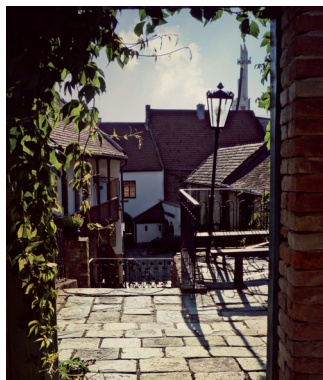
Nádvoří domu U Synků