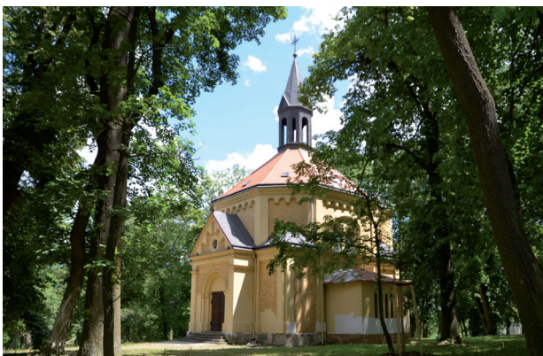
Kaple sv. Rocha na Křížovém kopci.

Pískovcová plastika z r. 2007 představuje 70000násobnou zvětšeninu vinné kvasinky. Je zapsána v knize českých rekordů jako největší zvětšenina živého organismu.