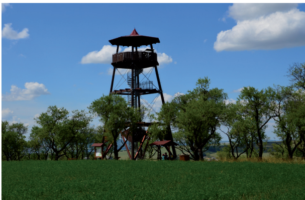
Rozhledna v mandloňových sadech.