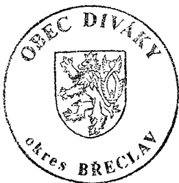
Kulaté razítko Obec