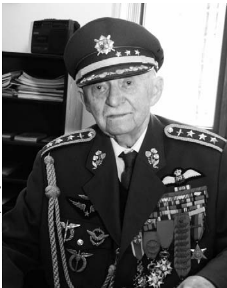
František Peřina při přebírání čestného občanství města Hustopeče v dubnu 2005.

Čestný občan města Hustopeče generál František Peřina by oslavil 8. dubna 2016 105. narozeniny. V roce 1911 se narodil v obci Morkůvky, která tehdy patřila k politickému