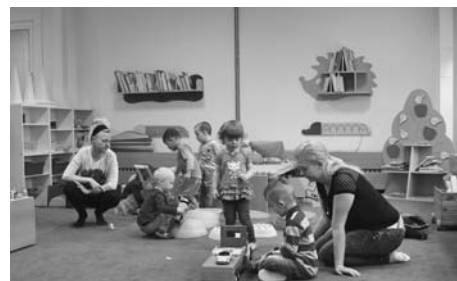
Zápis v MŠ Pastelka. Děti se seznámily s prostředím ve třídách a vyzkoušely i tamější hračky.

„V žádném případě nebudeme brát děti, které ještě mají pleny. Musí zvládat základní hygienické návyky. Měly by umět pít z hrníčku a nemít dudlík. K těmto nejmenším dětem se budeme snažit získat sociální asistentku, která učitelkám pomůže s dětmi, co se týče