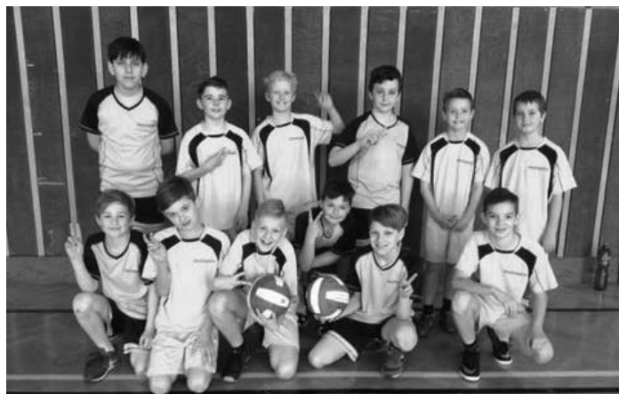
Okrskové kolo ve vybíjené a 2. místo pro naše borce.