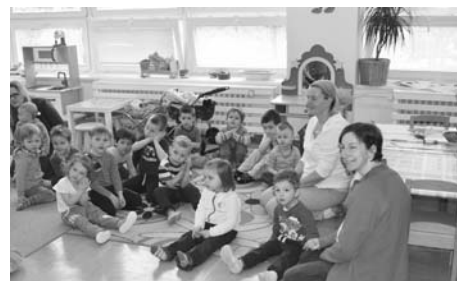
Zápis v MŠ U Rybiček. Děti se mohly zapojit do běžných činností školy.