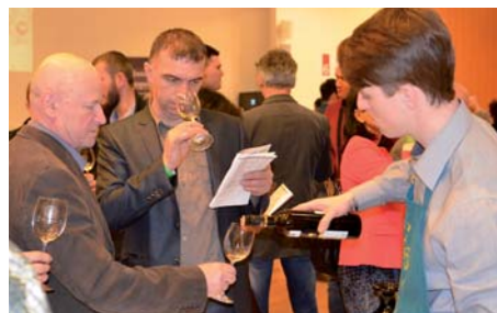
Soutěžní výstavu vín si nenechaly ujít zhruba dvě stovky návštěvníků.