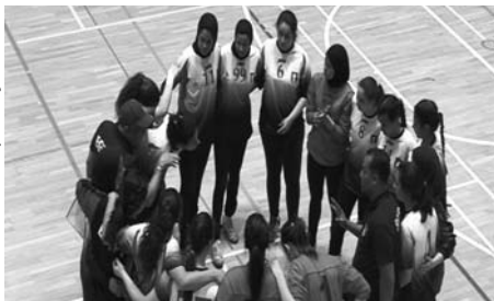
Egyptská juniorská reprezentace odehrála v Hustopečích i dvě přátelská utkání.

Sportovní hala patřila od pátku 15. do pátku 22. dubna juniorské reprezentaci v házené. Šestnáctka egyptských hráček se přijela do Hustopečí připravovat na světový pohár, o nějž budou bojovat v ruském Soči 30. července.