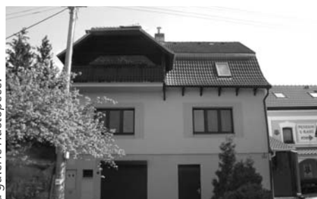
Rodný dům na Turhandlích.