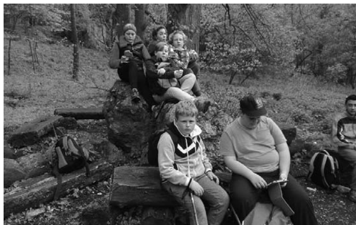
Druhý stupeň oslavil Den Země na Pálavě.