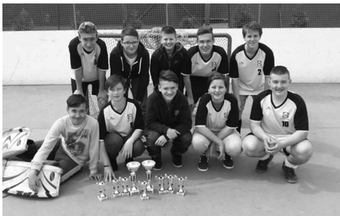
První místo v okrskovém kole soutěže „Hokejbalem proti drogám“.