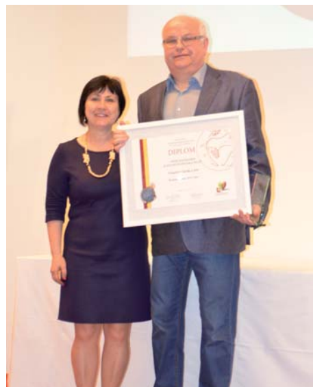
V kategorii sladkých vín získalo nejvyšší ocenění Vinařství Jurák a syn.