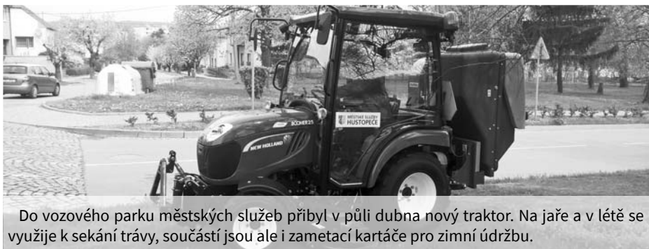
Do vozového parku městských služeb přibyl v půli dubna nový traktor. Na jaře a v létě se využije k sekání trávy, součástí jsou ale i zametací kartáče pro zimní údržbu.