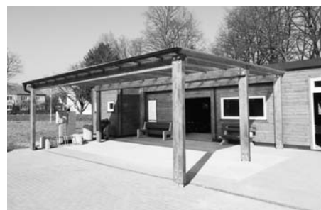
Nová pergola před učebnou.