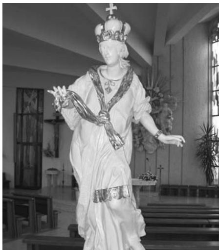
Opravená socha sv. Ludmily.