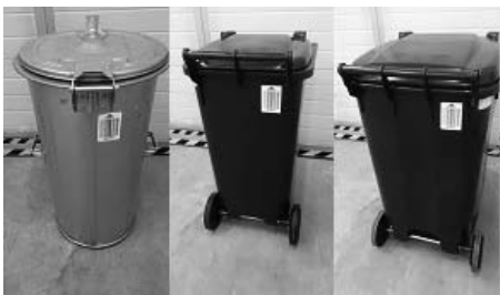
Čárové kódy vylepte ze zadní strany nádoby, nejlépe do pravé horní části.

Zelený čárový kód patří na biopopelnici – kód začíná písmeny HAB (např. HAB01232)