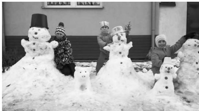
Konečně dorazila zima i do Hustopeč.