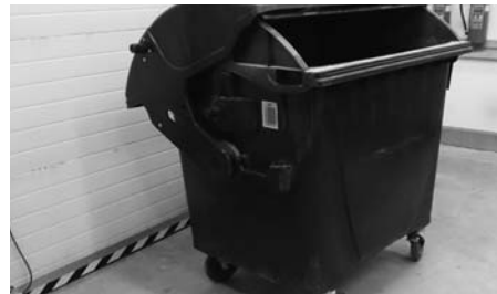
U kontejnerů o objemu 1100 litrů čárový kód vylepte na levý bok z pohledu zepředu.

Je důležité, aby čárový kód byl na nádobu vylepen na správné, očištěné a suché místo, aby byla zajištěna jeho trvanlivost (až 10 let) a aby se snadno a rychle pracovníkům svozové společnosti odečítal. I zdánlivě poškozený kód (poškrábaný, neúplný, vybledlý) není třeba vyměňovat do doby, než k tomu budete vyzváni pracovníky svozové společnosti nebo úřadu. V případě ztráty nebo úplného zničení kódu nebo popelnice se pro nový obraťte na MěÚ Hustopeče, odbor životního prostředí. Zde také rádi odpovíme na Vaše dotazy.