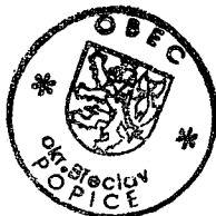
(kulaté razítko Obec)