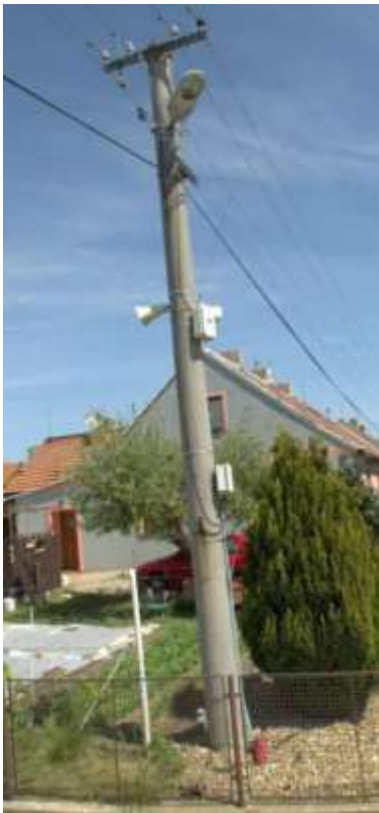
Obr. 3 – betonový sloup

Název projektu: Strategické řízení a pasportizace města Hustopeče Registrační číslo projektu: CZ.03.4.74/0.0/0.0/17_080/0010098