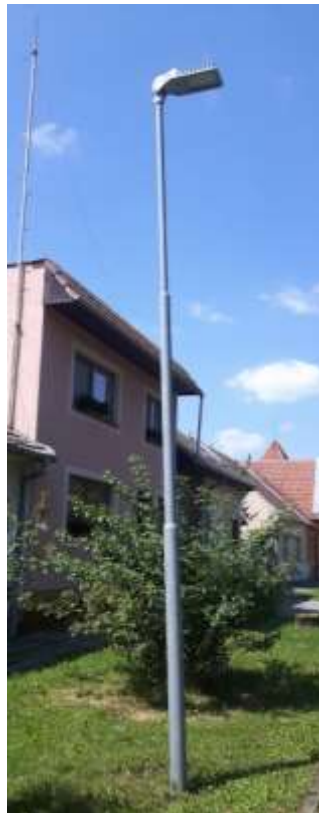
Obr. 4 – kovový sloup