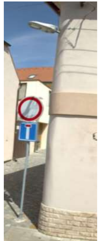
Obr. 5 – světlo na fasádě