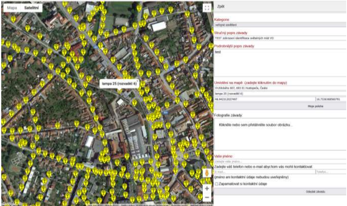
Obr. 6 – mapa závad Hustopeče

Název projektu: Strategické řízení a pasportizace města Hustopeče Registrační číslo projektu: CZ.03.4.74/0.0/0.0/17_080/0010098