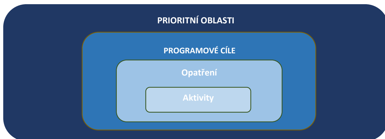
SCHÉMA NÁVRHOVÉ ČÁSTI

Zapojením pracovníků Městského úřadu Hustopeče, vedení města a veřejnosti došlo ke zpracování dokumentu, který byl podroben připomínkovému řízení ze strany dotčených orgánů a osob.